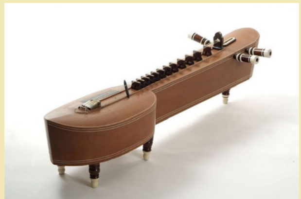
Takhe Cítara de caja pulsada · Camboya

Las exposiciones pueden contener una colección de instrumentos del mundo, o fotografías de las culturas de origen, u ofrecer recorridos sonoros por diferentes culturas.