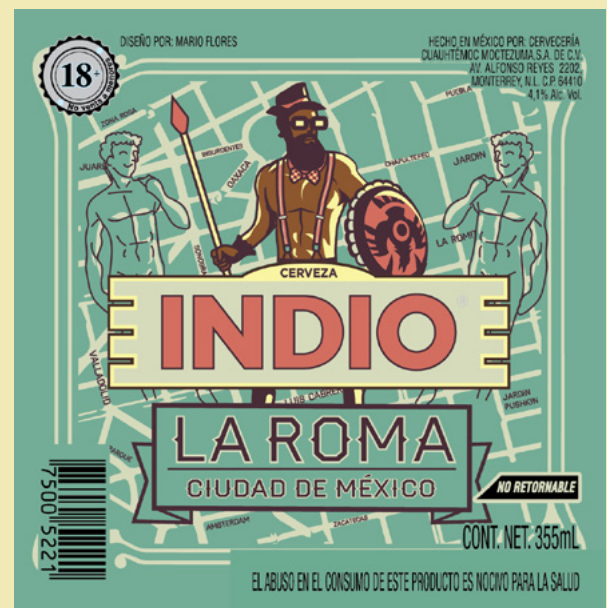
Campaña cerveza Indio Colecciona las etiquetas