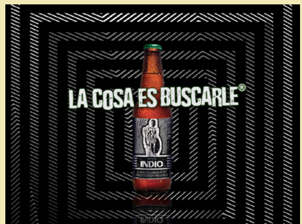
Cerveza Indio Recurso Op-Art